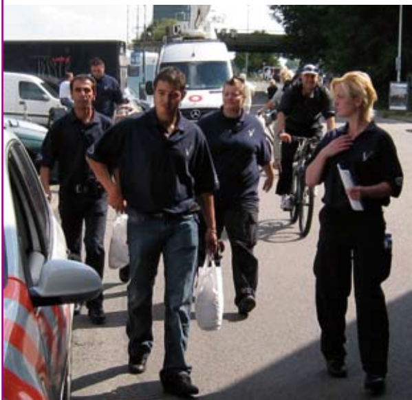
250 beveiligers op de been

Stichting ProGay voert een actief beleid om de botenparade van verrassende impulsen te voorzien en om inhoud te koppelen aan feest.