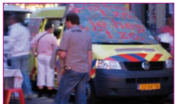
Gratis prik bij GGD

Gedurende drie dagen was er de mogelijkheid om inenting te halen tegen hepatitis bij de GGD. Het Aidsfonds heeft toestemming gekregen om te collecteren tijdens de botenparade en verschillende feesten. Door strengere eisen was er minder ruimte voor het Aidsfonds op het water, hetgeen de opbrengsten helaas toch heeft gedrukt.