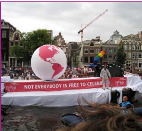
Lege boot van Hivos

In 2008 is deze inhoudelijke lijn doorgezet. Hierdoor hebben een groot aantal politici en 'hetero-normatieve' maatschappelijke organisaties deelgenomen aan de botenparade. Dit zijn niet alleen minister Plasterk en collega's en burgemeester Cohen, maar ook de politie in uniform als deelnemers, de Antillianenboot en de boot met homoseksuele christenen. De boodschap is dat homoseksualiteit een onlosmakelijk deel van de maatschappij is, en gezien kan worden als verrijking van de maatschappij en de moeite waard om in bescherming te nemen. Daarmee is de botenparade definitief het feesten sec ontstegen maar is het ook een emancipatiemachine geworden.