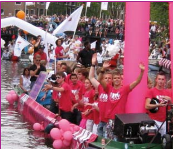
16min vaart in 2008 voor tweede keer mee

In het najaar van 2006 is ProGay in gaan zetten op inhoudelijke verdieping en verbreding van de Amsterdam Gay Pride. Dit heeft in 2007 onder meer vorm gekregen door taboedoorbrekende emancipatie van homoseksuele 16-minners, de boot met verstandelijk gehandicapte homo's en de Oost-Europa boot met delegaties uit Europese landen waar Gay Prides problematisch zijn. Ook heeft toen voor het eerst een conferentie over homoseksualiteit in Oost-Europa plaatsgevonden, alsmede de conferentie Company Pride die voor het eerst plaats vond. De boten met het thema 'company pride = personal pride' voeren voor het eerst mee in 2006 toen ProGay eveneens de parade organiseerde. Dat het vernieuwde beleid succesvol was bleek daags na de Pride toen de Volkskrant op de voorpagina de kop bracht: 'Feest met een inhoudelijk randje'.