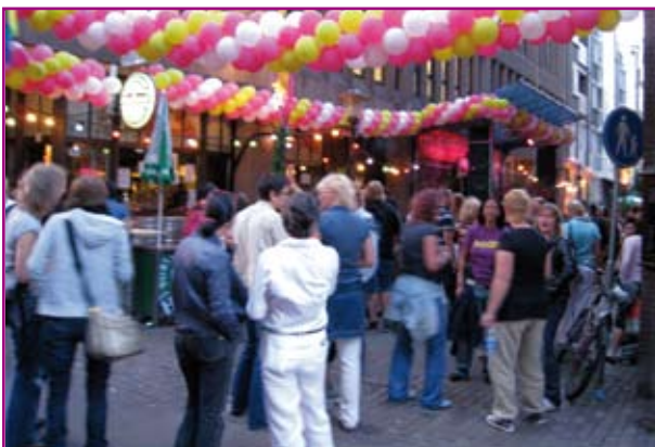
Vrouwenfeest komt op gang

Voor lesbische vrouwen waren er specifieke vrouwenfeesten en een gedeelte van het filmprogramma bestond uit lesbische films. Voor de ouderen was er een door COC Amsterdam georganiseerde en druk bezochte lunch in het Amsterdams Historisch Museum. Ook het cultuurprogramma is bij de ouderendoelgroep extra onder de aandacht gebracht.