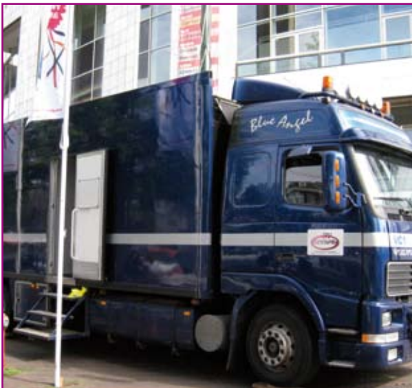
Commandowagen voor communicatie en goed verloop

Naast een recordaantal bezoekers heeft ook een recordaantal boten deelgenomen aan de botenparade. Dit was mogelijk nadat een aantal extra maatregelen was getroffen. Zo zorgden stremmingen op de grachten dat er minder particuliere boten de doorgang blokkeerden, was de start zeer overzichtelijk door voor het eerst te werken met startvakken, en bleef chaos op de Amstel uit door de vaargeul die was aangegeven met boeien. Ook was een zwaarder communicatienetwerk opgezet en waren schippers nadrukkelijker geïnstrueerd. Er waren nagenoeg geen incidenten, de doorvaart was tijdig afgerond en de communicatie verliep soepel.