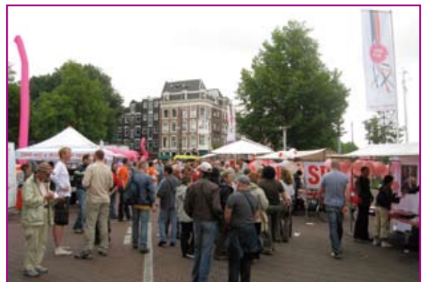
Informatiemarkt op Stoperaplein

Op zondag vond de informatiemarkt plaats. Er waren partijen uitgenodigd die door middel van aankleding en gebruik van eigen stands de informatiemarkt een evenementen-karakter geven. De bezoekers waren voornamelijk bezoekers van het slotfeest. Naast homo-organisaties waren het ING, het Aidsfonds, politieke partijen en politie aanwezig.