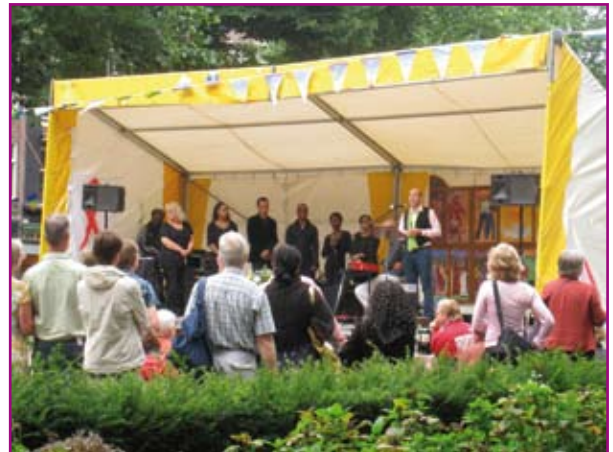
Openlucht kerkdienst druk bezocht

werend te worden. Op de bewuste zondag vond ook een joodse dienst plaats; Queer Shabbatan.