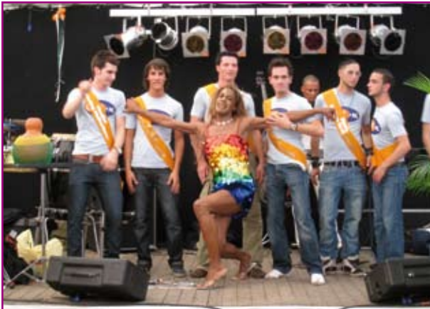
Mister Gay-kandidaten op het Kwakoe festival

Dit jaar vond voor het eerst de roze zondag voor de Amsterdam Gay Pride plaats op het Kwakoe festival. COC Amsterdam speelde hier samen met de GayGroup (organisatie Mister Gay Netherlands verkiezing) een belangrijke rol in. Hiermee is de Amsterdam Gay Pride buiten het centrum gebracht, en dan ook nog een keer naar de Bijlmer waar homoseksualiteit op z'n best gezegd nog een taboe onderwerp is. Ook met deze innoverende activiteit maakt de Amsterdam Gay Pride haar rol als emancipatiemaker waar. Een nieuwe traditie lijkt in ieder geval met deze dag te zijn gestart. Bijzonder was ook de couscous-maaltijd waarbij homoseksualiteit en moslim-zijn centraal stonden. Burgemeester Cohen was ook present.