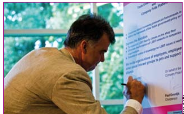
FNV sluit convenant met Company Pride Platform

Naast cultuur was er dit jaar ook aandacht voor inhoudelijke activiteiten. In het oog springend was het Company Pride platform. In aanwezigheid van minister Plasterk en burgemeester Cohen, werd een convenant gesloten met de FNV om homofobie op de werkvloer te bestrijden. Ook de ontvangst van de Turkse delegatie en de aanwezigheid van delegaties van homo-activisten uit Oost-Europese landen gaven de Amsterdam Gay Pride extra lading.