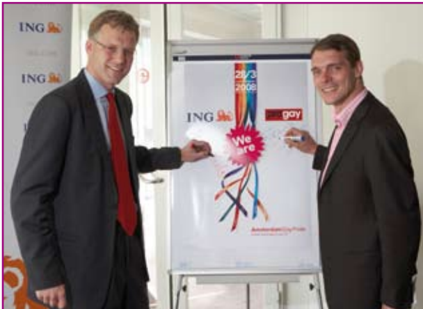
ProGay en ING tekenen het sponsorcontract

Het beleid van ProGay om de Amsterdam Gay Pride uit te diepen en te verbreden heeft ook nieuwe sponsors aangetrokken. ING en TNT zijn de pioniers op dit vlak geweest. Het fundament voor toekomstige sponsorwerving is evenwel nog uitermate zwak.